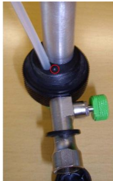
Überarbeitete Pumpe mit Markierung